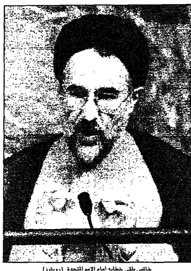
خاتمي يلقي خطابه امام الامم المتحدة

وفي تصريح خاص لـ القدس العربي - استبعد نائب وزير الخارجية حدوث اي اتصالات بين المسؤولين امريكيين وايرانيين أثناء زيارة خاتمي لنيويورك، وقال جواد طرقي اننا ننظر بحذر الى التصرفات امريكية، وأوضح ان هناك مؤشرون ايجابية صرحت من الرئيس امريكي بيل كلينتون ووزيرة الخارجية مادلين اولبرايت ونائب وزير الخارجية الذي انسى به كلينتون في اواخر شهر شباط (فبراير) القادم (وسمي الاجتماع الذي راسه الامم العام كوفي امان وشاركت